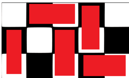
Figur 1 Et spil på en 5 \times 3 -plade. Det er spiller 2's tur, men han kan ikke lægge en brik og taber derfor spillet.

Noget af det interessante ved Domineering er at hvis nogle brikker på et tidspunkt i spillet deler de resterende felter op i to disjunkte grupper, så kan man fra da af anskue spillet som summen af de to spil der spilles på de to disjunkte spilleplader. Dette er en fantastisk egenskab når man ser på spillet med spilteoretiske øjne.