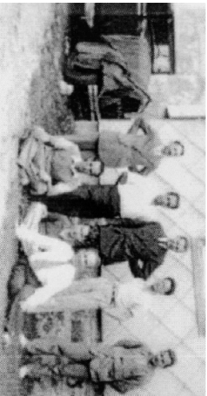
Bourbakis første kongres, juli 1935

På mødet blev det foreslået at omfanget af deres værk maksimalt skulle være på 1000-1200 sider og at de første bøger skulle være færdige indenfor et halvt år. De startede med at planlægge det præcise indhold i bøgerne, som de var enige om skulle være så moderne som muligt, men det første møde var forståeligt nok, ikke langt nok til at diskutere dette til ende. De fortsatte med at mødes hver anden uge på selsamme café i et halvt års tid, hvorefter de skiftede til at holde kongresser. På dette tidspunkt havde der allerede været flere nyankomne og flere, som var smuttet. For at være konsistente, besluttede de sig at give gruppen et fælles navn, der skulle være eneste forfatter på deres fremtidige bøger. Det navn var Bourbaki.