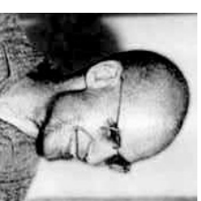
Grothendieck, skaberen af moderne algebraisk geometri, var også medlem af Bourbaki

skulle dække det. Men de strukturer man arbejder i i analysen måtte jo også være dækket, før man kunne begynde på analysen - dette krævede pludselig bøger om de forskellige algebraiske strukturer samt topologi. De forventede nu pludselig at deres værk ville fylde ca. 3200 sider - allerede en tredobling af hvad de først havde snakket om!