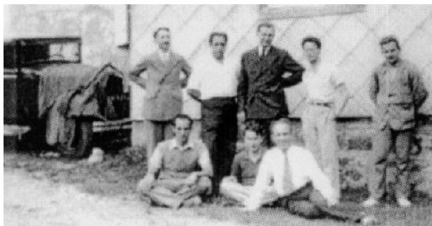
Bourbakis første kongres, juli 1935

På mødet blev det foreslået at omfanget af deres værk maksimalt skulle være på 1000-1200 sider og at de første bøger skulle være færdige indenfor et halvt år. De startede med at planlægge det præcise indhold i bøgerne, som de var enige om skulle være så moderne som muligt, men det første møde var, forståeligt nok, ikke langt nok til at diskutere dette til ende. De fortsatte med at mødes hver anden uge på selvsamme café i et halvt års tid, hvorefter de skiftede til at holde kongresser. På dette tidspunkt havde der allerede været flere nyankomne og flere, som var smuttet. For at være konsistente, besluttede de sig at give gruppen et fælles navn, der skulle være eneste forfatter på deres fremtidige bøger. Det navn var Bourbaki.